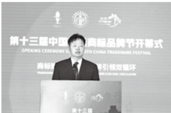
国家知识产权局党组成员、副局长胡文辉致辞

开幕式上，国家知识产权局党组成员、副局长胡文辉，广东省市场监督管理局（知识产权局）党组书记、局长刘光明，广东省人大常委会