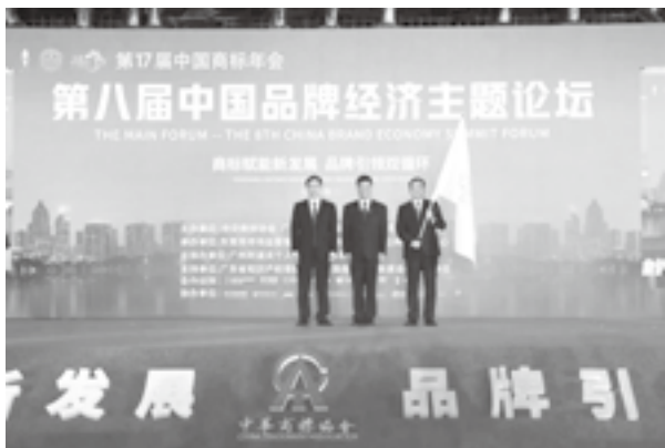
第十四届中国国际商标品牌节授旗仪式

本届年会在继承传统论坛模式的同时，还注重创新论坛模式，举办商标行政保护局长论坛、区域品牌发展市县长论坛、老字号商标品牌保护与发展论坛等20余个分论坛及商标沙龙活动。其中，围绕地理标志与乡村振兴、知识产权数据与品牌高质量发展、系统治理商标恶意注册、商标代理专业人员队伍建设等热点话题，本届中国商标年会新增“加强地理标志商标注册 助力乡村振兴”研讨会、“共享·融合·赋能——知识产权数据助力品牌高质量发展”交流研讨活动、“系统治理商标恶意注册 助推经济高质量发展”研讨会和中知人才论坛——构建中国商标人才新生态等。此外，特举办2023年广东商标品牌发展论坛，推介举办地商标品牌发展经验，发挥广东对全国各地商标品牌工作的示范引领作用；举办东莞市市场监督管理局（知识产权局）——商标品牌赋能东莞高质量发展创新论坛，引导东莞企业利用商标赋能新发展，助力东莞品牌向“东莞智造”转变，实现弯道超