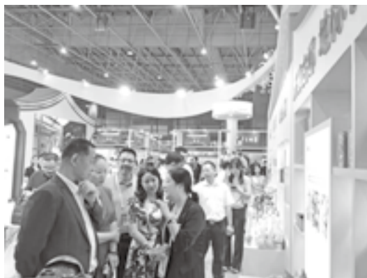
国家知识产权局商标局局长崔守东来漳州馆巡馆

漳州市市场监督管理局携漳州优质地理标志产品及高知名度商标品牌集体亮相2023中华品牌商标博览会。漳州馆围绕“漳州地标 山海盛宴”集漳州传统文化元素与现代设计于一体，展示漳州优秀地理标志产品及高知名度商标品牌。展品品类丰富，活动精彩纷呈，展馆现场热闹非凡，吸引了众多业内专家和观展群众上万人次到馆参观，成为观展人员的热门打卡点之一。