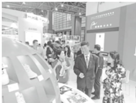
中华商标协会会长马夫来莆田馆巡馆

时展示15家参展企业自主商标，设置自主品牌鞋展示选购、鞋业制作新材料展示、个性化3D定制、产品质量体验、线上直播推广等多个区域，全面展示莆田鞋的风采。展会期间，前来参观、体验、咨询的人流络绎不绝。