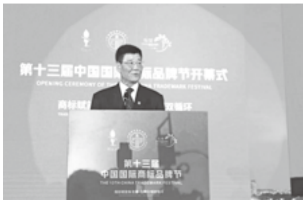
中华商标协会会长马夫主持开幕式