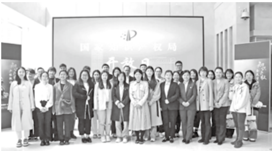
商标局代表和嘉宾合影

在商标局工作人员带领下,受邀嘉宾还参观了商标大楼商标注册大厅、商标档案库房和历史档案资料等,并与商标局专家进行了座谈交流。