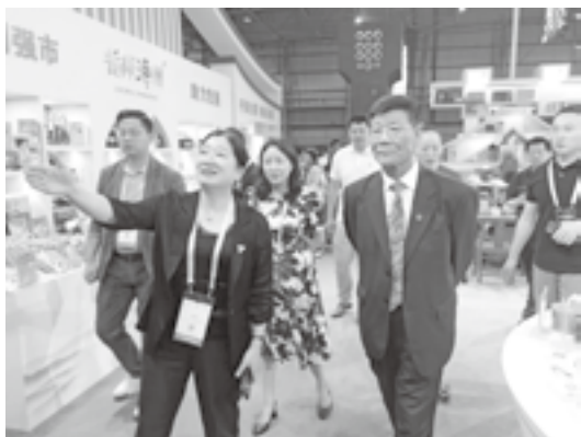
中华商标协会会长马夫来漳州馆巡馆

莆田鞋展示馆围绕“匠心质造 莆田好鞋”主题，融合莆田鞋区域品牌广告语“莆田鞋 行天下”以及“中国鞋都”称号等元素设计搭建。展馆以莆田鞋PT图形集体商标为视觉核心，同