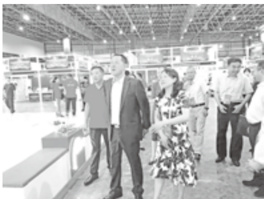
国家知识产权局商标局局长崔守东来莆田馆巡馆

本次活动，我会积极配合福建省市场监督管理局（知识产权局）组织漳州、莆田两地亮相中华品牌商标博览会，分别建馆，展示了我省颇具特色的商标品牌风采，得到参会嘉宾及广大观展群众的喜爱与好评，福建省市场监督管理局荣获组委会颁发的“2023中华品牌商标博览会卓越贡献奖”。漳州市、莆田市市场监督管理局（知识产权局）及我会荣获“2023中华品牌商标博览会贡献奖”。