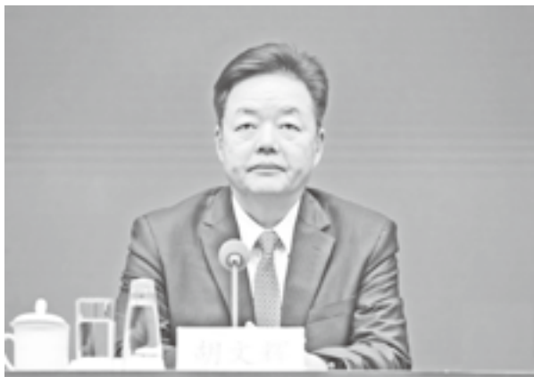
国家知识产权局副局长胡文辉

四是加大宣传推广。充分利用中国品牌日、中国知识产权年会、中国国际商标品牌节等平台，推广商标品牌建设典型经验，宣传推介精品国货。通过组织开展全国知识产权宣传周等活动，不断提升公众知识产权意识，积极营造