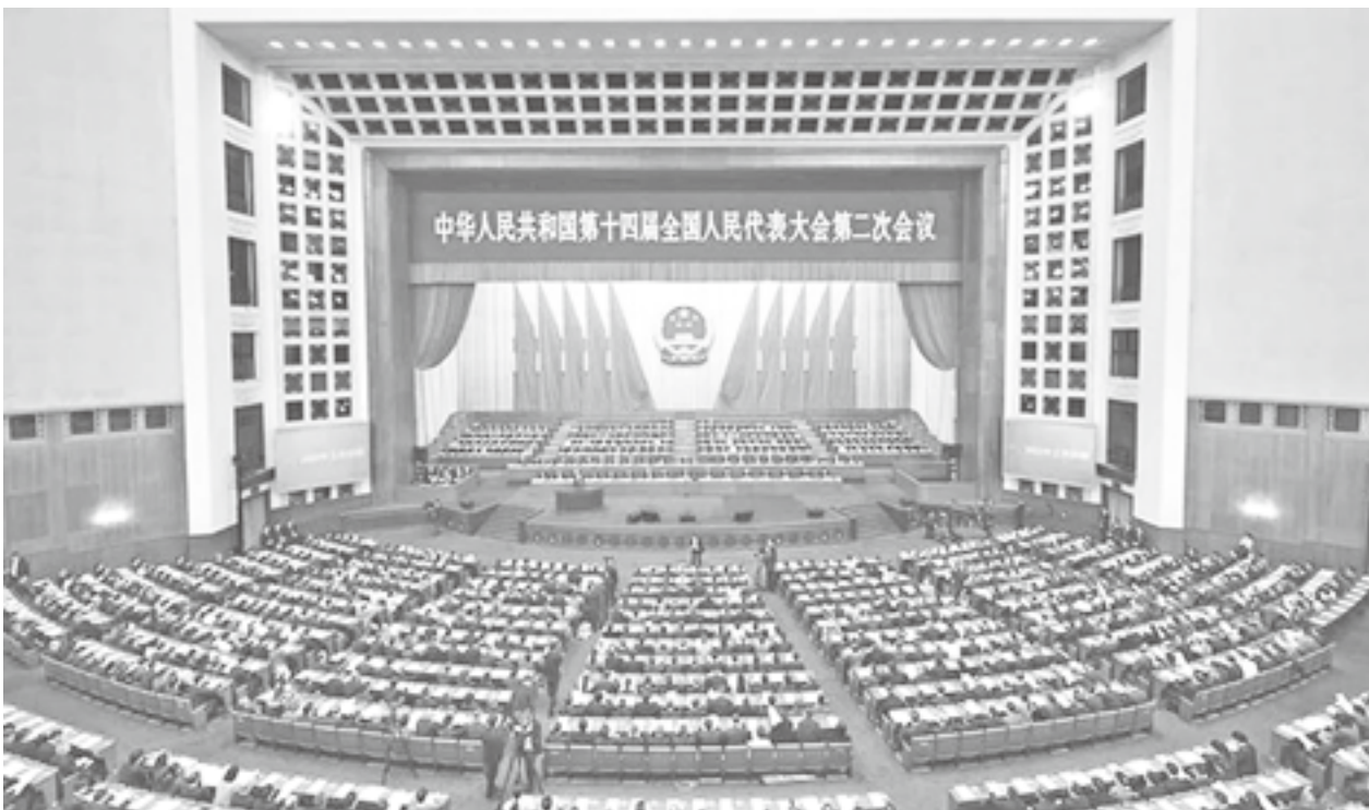
3月5日，第十四届全国人民代表大会第二次会议在北京人民大会堂开幕。

在部署今年工作时，报告首先提出“加快发展新质生产力”，同时在过去一年工作总结中，